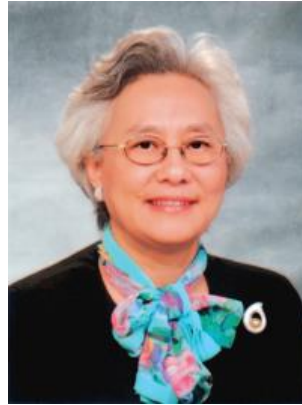
平等機會委員會主席 朱楊珀瑜

在最近舉行的周年新聞發佈會上，我向傳媒簡介了平等機會委員會在 2003 年的工作，以及一項有關公眾對本委員會看法的調查結果。我提到查詢及投訴增加了 31%，亦講述我們如何處理與非典型肺炎有關的個案。當時有很多提問，關注到委員會將如何進一步在本港建立公信力。我指出為了應付挑戰，本會將會採納 3C 策略：即鞏固原有工作 (consolidation) 提升運作能力 (capacity building) 和全面增進溝通 (communication)。